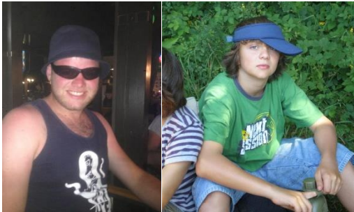
Zwakke Sifaka Onbenullige Specht